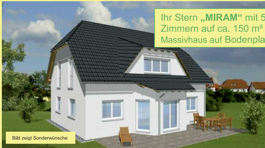
Bild zeigt Sonderwünsche

Ihr Stern „MIRAM“ mit 5 Zimmern auf ca. 150 m 2 Nfl. Massivhaus auf Bodenplatte