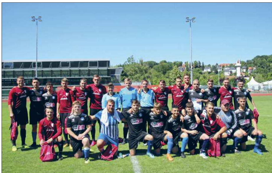
Im roten Trikot sind die Spieler des TSV 1848 und im schwarzen Trikot die Spieler aus Méricourt zu sehen.

Auf Einladung des Oberbürgermeisters Volker Holuscha wollte eine Delegation von Gästen der Partnerstadt Méricourt zu den Festlichkeiten des 100-jährigen Fußballjubiläums des TSV 1848 e.V. Ende Juni in unserer Stadt.