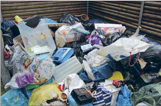
Müll jeglicher Art wurde an den Glascontainern am Standort Waldstraße abgelegt.

Weiter fügte der Oberbürgermeister hinzu, „Gerade Elektroschrott und Sperrmüll könne kostenlos an allen Wertstoffhöfen im Landkreis abgegeben werden. Wenn ich mir schon die Arbeit mache und meinen Müll dahin karre, dann kann ich auch direkt zum Wertstoffhof fahren“.